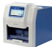
NA Extraction AutoPure 32 A - ALLSHENG