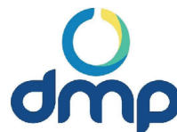
Klinik Duta Medika Pratama