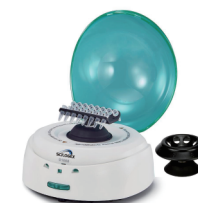
Ezee Mini-Centrifuges - SCIOGEX