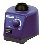
VORTEX - SCIOGEX