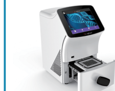
PCR Q1000+ - LongGene