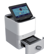
PCR Q2000C - LongGene