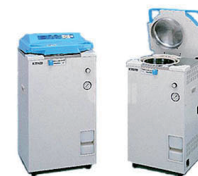
AUTOCLAVE - HIRAYAMA